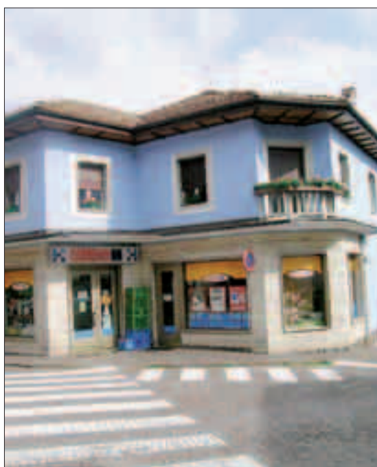
La sede della Famiglia cooperativa di Varena