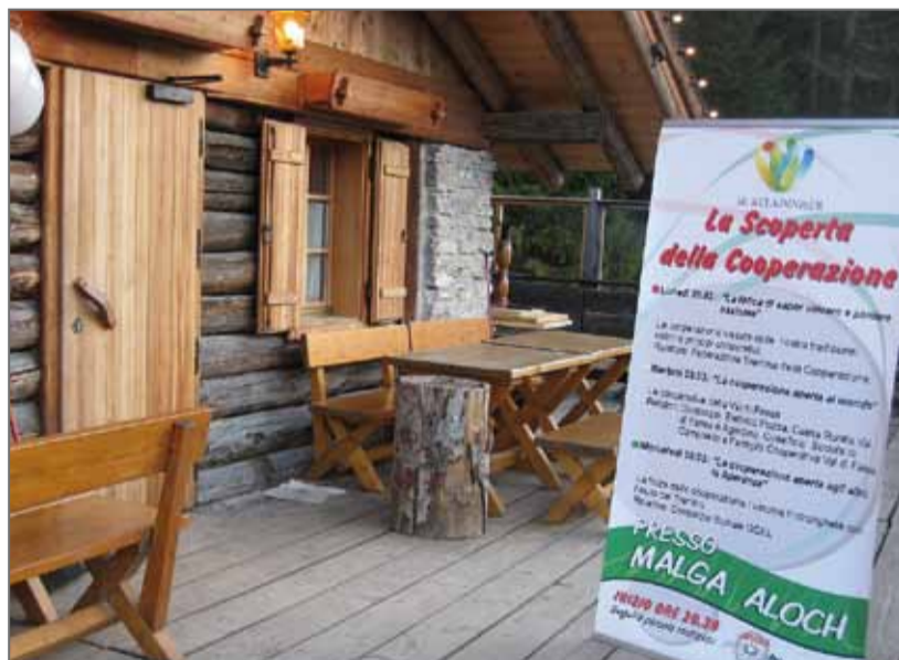
L placat de la scomenzadiva metù fora a l'entrèda de la Malga Aloch.

Tegnir i refletores empeé sun chesta realtèdes l'é fundamentèl per les vardèr via colajù, che no les vegne dessatèdes, ma ence percheche nesc joegn sie enjigné a se parèr ence chiò da risesc che no i revèrda semper e demò i etres.