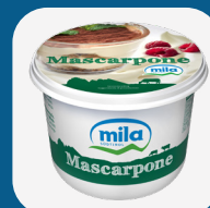
Mascarpone Mila 500Gr.