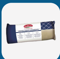
Form. Filone Affumicato Galbani 2Kg