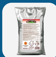
Pecorino Romano Quattrocolli Gratt. 1 Kg