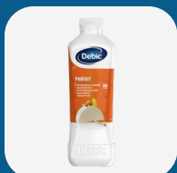
Parfait Debic Lt.1