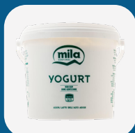
Yogurt Mila 5Kg Bianco Cremoso