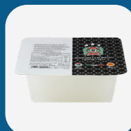
Mozz. Bufala Campana Dop 40X25Gr.