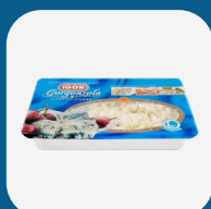
Gorg. Cubetti Igor Gr.500